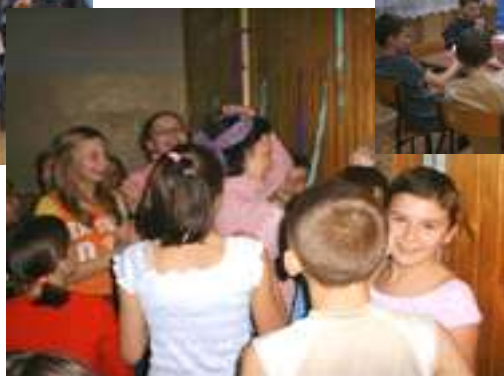
Czary, mary, hokus, pokus

Król zwierząt wezwał poddanych i mówi: - Ci z was, którzy są mądrzy, przejdą na lewą stronę, a ci, co są ładni, na prawą. Zwierzęta przechodziły, została tylko żaba. Lew pyta: - A ty co? - Przecież się nie rozerwę - odpowiada żaba